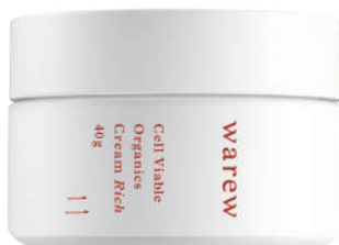
クリーム リッチ 40g

手のひらでエマルジョンを温めて、お顔全体にいきわたらせます。 法令線を引き上げるように手のひら全体で引きあげながら、耳の下（耳下腺）まで流します。 額も同様にシワをのぼすように引き上げながらこめかみを通り、耳の下（耳下腺）まで流します。